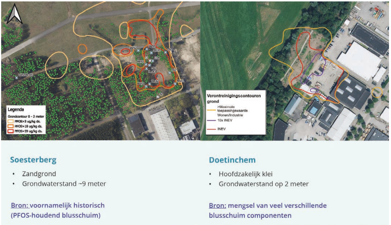
Figuur 1: Overzicht van de PFAS-verontreinigingen in Soesterberg en Doetinchem.

Hergebruik van snoeiafval is mogelijke verspreidingsroute voor PFAS