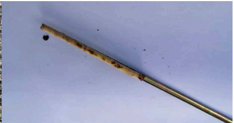
Figuur 2: Höglof sampler (links) en geëxtraheerde boomkern (rechts) - Foto's onderzoek Doetinchem.